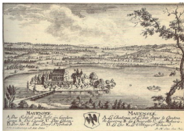
Alter Stich Schloss Mauensee