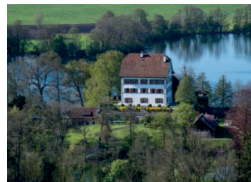
Schloss Mauensee heute

Eigentümer des Schlosses Mauensee zwischen 1275 und heute