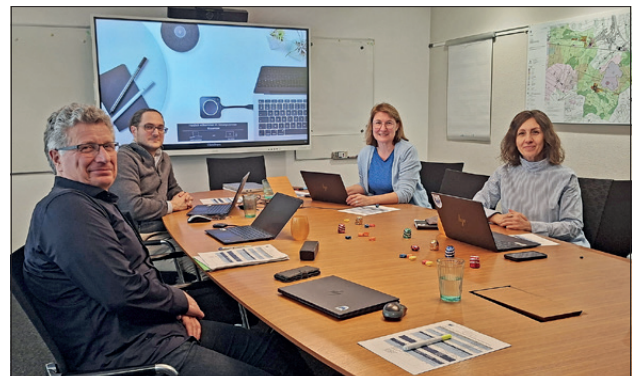
Gemeinderat Mauensee Klausurtagung März 2026

Alle Einwohnerinnen und Einwohner sind eingeladen, ihre Meinung einzubringen und damit die künftige Entwicklung von Mauensee aktiv mitzugestalten. Die Umfrage wird im Frühjahr 2026 durchgeführt. Der Gemeinderat freut sich auf eine rege Beteiligung und dankt der Bevölkerung bereits heute herzlich für das Engagement.