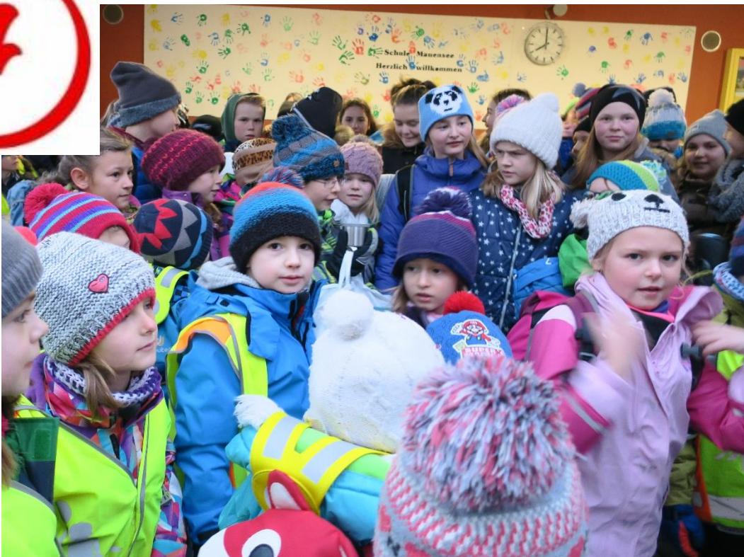
Aufbruch zur Waldweihnacht