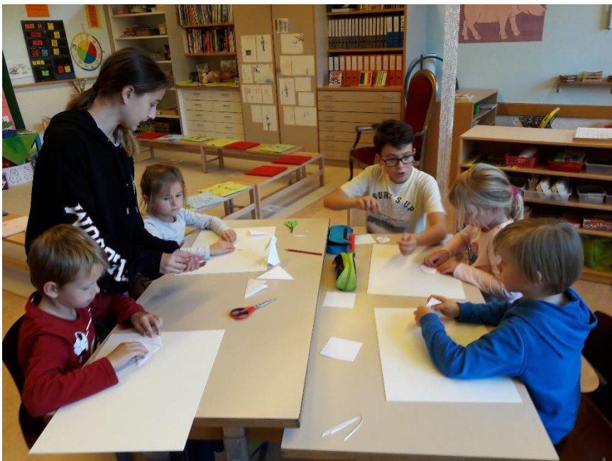
Besuch von Gotte und Götti

Bei der Klasseneinteilung in eine der drei Abteilungen der altersgemischten Basisstufe an der Schule Mauensee achten wir auf eine Durchmischung der Dorfteile Chotten, Dorf und Kaltbach. Jedes Kind der Basisstufe erhält einen Götti oder eine Gotte aus der 5. oder 6. Klasse. An verschiedenen Anlässen mit der ganzen Schulgemeinschaft lernen sich die Kinder untereinander kennen.