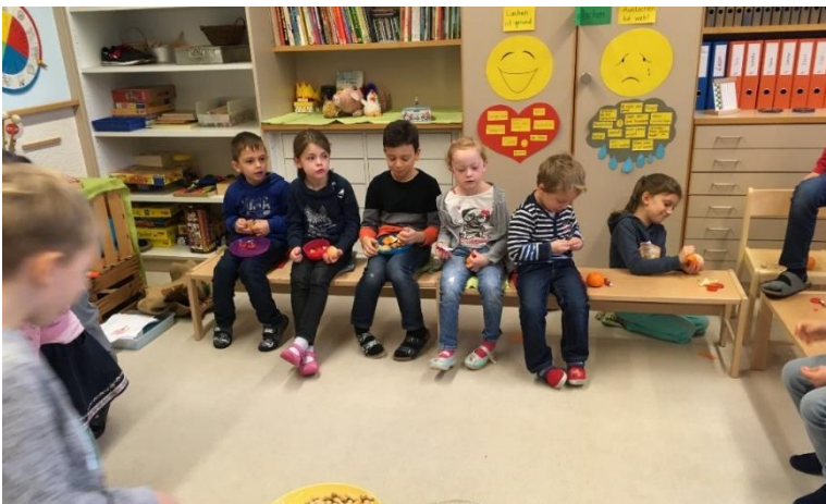
Spielen - Lernen - Züni Essen

Dabei gehen Spielen und Lernen fließend ineinander über. Die Basisstufe bietet den Kindern ein pädagogisches Umfeld, in welchem jedes Kind Anregungen, Aufgaben und Anforderungen erhält, die seinem Entwicklungsstand und seinen Interessen entsprechen. Die drei Basisstufen an der Schule Mauensee arbeiten in vielen Bereichen zusammen. Die Unterrichtsthemen sind abgesprochen und werden oftmals parallel behandelt. Jede Klasse hat natürlich auch ihre eigenen Besonderheiten.