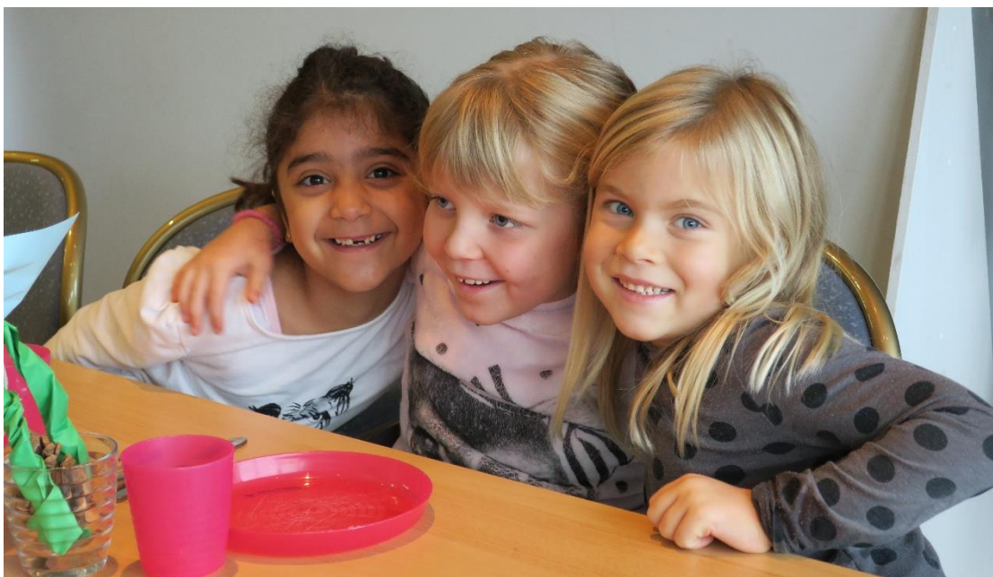
Uns gefällt's in der Basisstufe