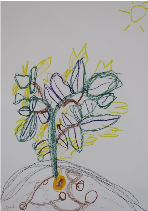
Übung 1 Graphomotorik